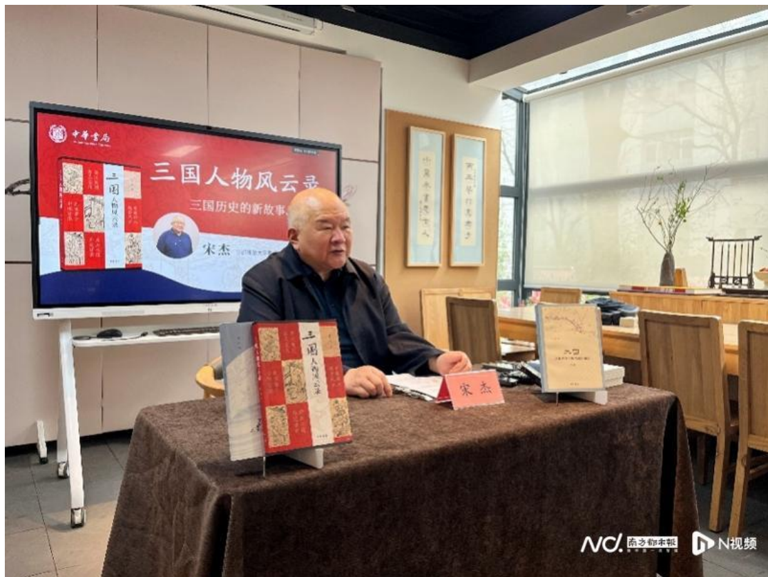
البروفيسور SONG JIE

مؤخرًا، أثارت أنباء إزالة تمثال Guan Yu في Jingzhou الكثير من النقاش على الإنترنت. لقد سمعنا جميعًا قصة Liu Bei واقتراضه لـ Jingzhou، ولكن ما هي الإنجازات الملحوظة لـ Guan Yu في Jingzhou؟ إذا كنا سنبحث عن رمز لـ Jingzhou، هل سيكون Guan Yu المرشح الأنسب؟ ما مدى أهمية الموقف الاستراتيجي لـ Jingzhou خلال عصر الممالك الثلاث؟ البروفيسور Song Jie من جامعة Capital Normal، والذي لديه خلفية بحثية كبيرة في الجغرافية التاريخية للممالك الثلاث، وكتب كتاب 'البحث عن المواقع الاستراتيجية والاستراتيجيات الهجومية والدفاعية للممالك الثلاث'، هنا لإلقاء الضوء على هذه الجوانب. دعت مجلة 'Wei Shi Ji' الأسبوعية البروفيسور Song ليحكي لنا قصة Guan Yu و"Jingzhou."