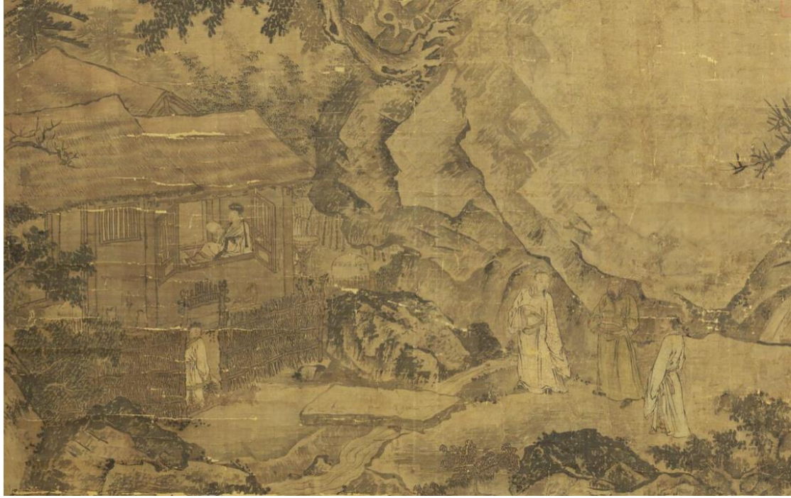
الزيارات الثلاث لـ ZHUGE LIANG

المراسل: هل يمكنني السؤال عما إذا كانت هناك أي تغييرات في الأهمية الإستراتيجية لـ Jiangling خلال فترة الممالك الثلاث؟