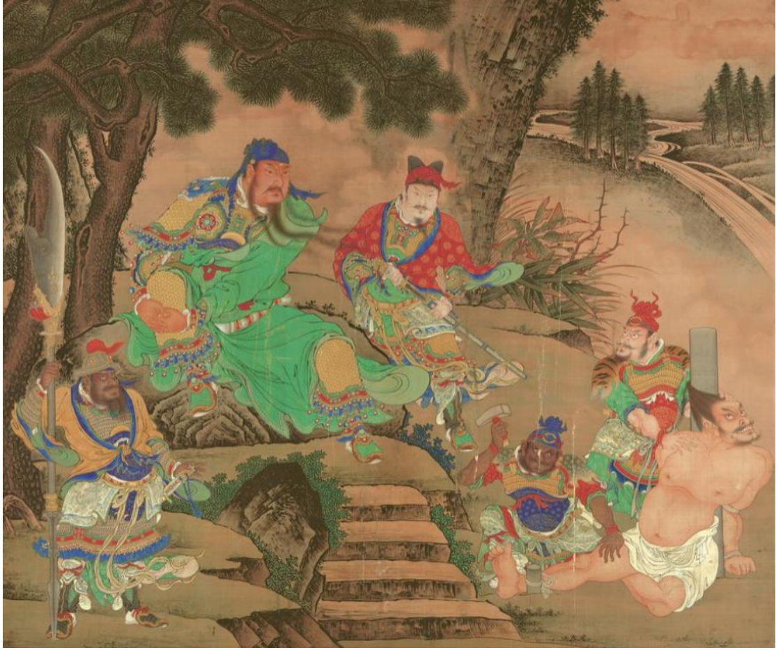
لوحة بعنوان GUAN YU يقبض على الجنرال

المراسل: ما هي الأهمية الاستراتيجية لمدينة Jiangling بعد فترة الممالك الثلاث؟